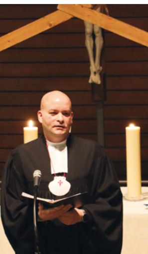
Gottesdienste in der Weihnachtszeit