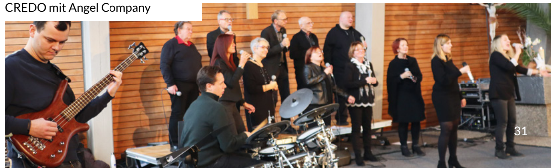
CREDO mit Angel Company