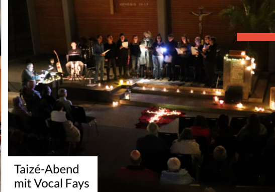
Taizé-Abend mit Vocal Fays