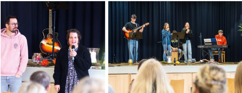
Oben Schnappschüsse von den CREDO Gottesdiensten im Frühjahr.